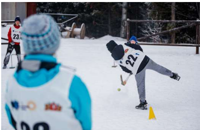
Этап соревнований - "хоккей в валенках"