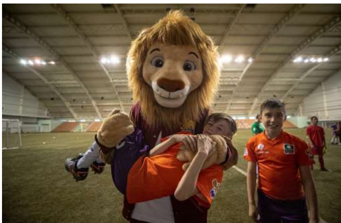
Волонтеры - ССК "Прайд" УиУ РАНХиГС