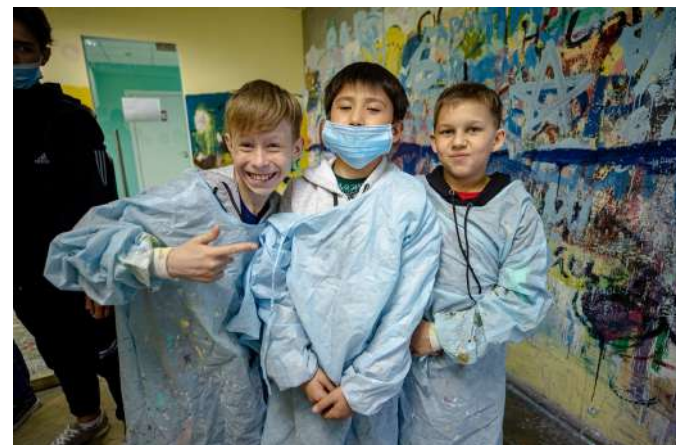
Экскурсия в "Дом профессий"