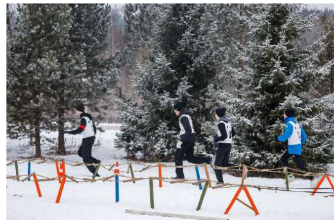
Этап соревнований - ОФП