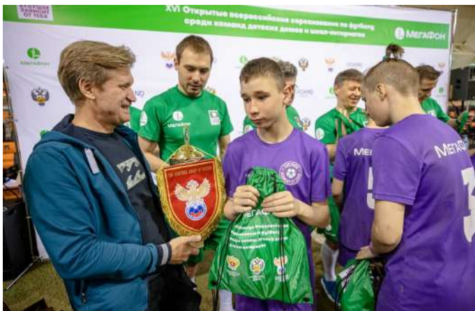
Награждение победителей соревнований