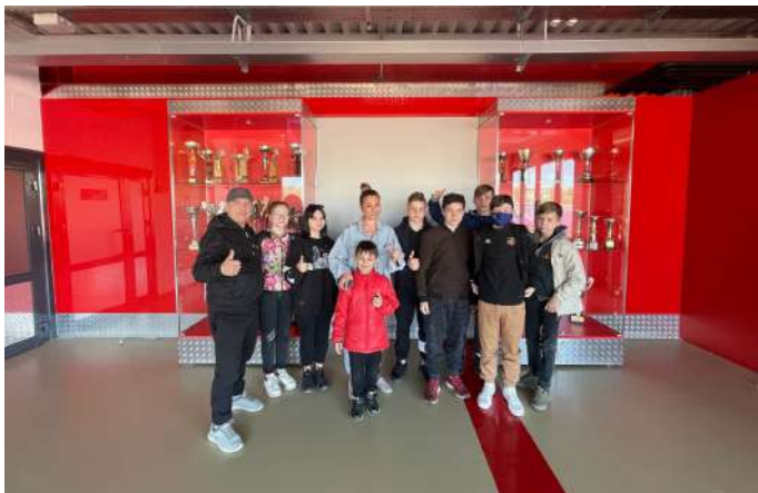
Мероприятие в Дацюк-Арене