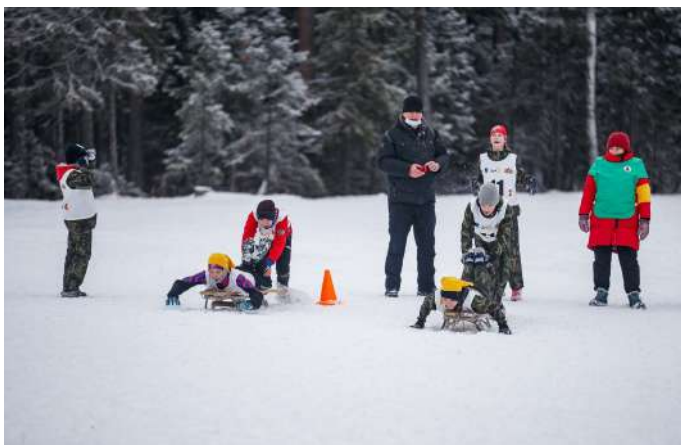
Этап полосы препятствий - "зимние забавы"