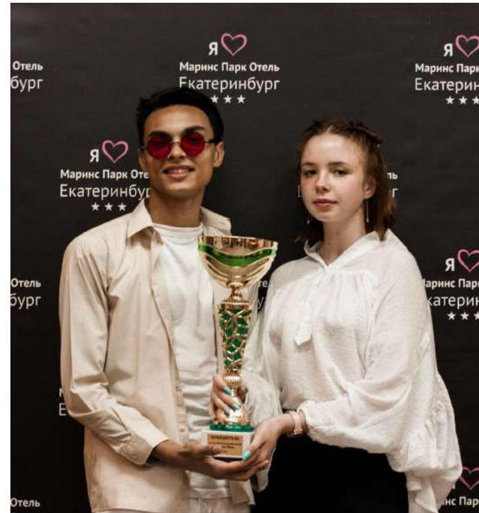
Победители квиза - команда Синарского СРЦН