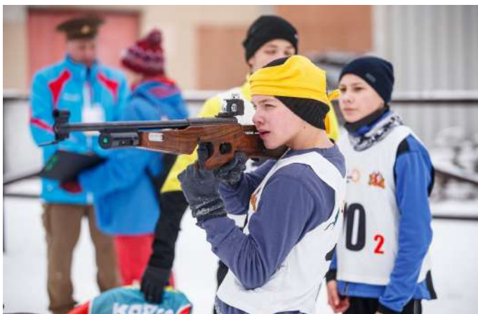
Огневой рубеж с использованием БИТЛС