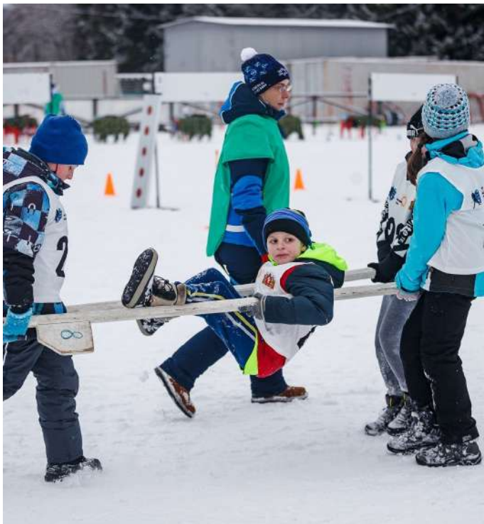
Этап соревнований - "туристический этап"