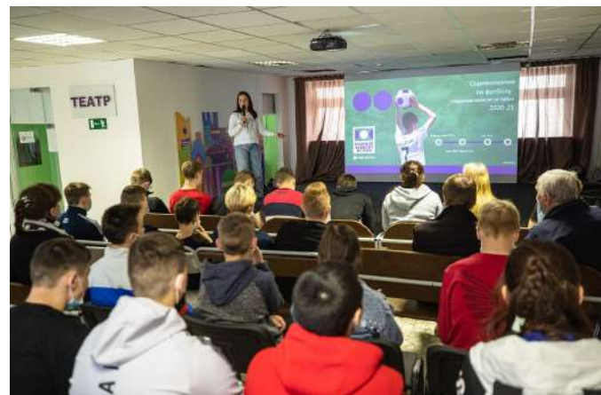
Проориентационный квиз от Мегафона на Урале