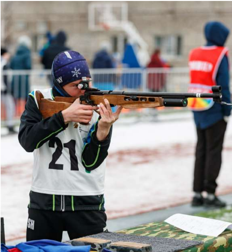
Фото с мероприятия «Лазерная пуля», программа «Чемпионы будущего»