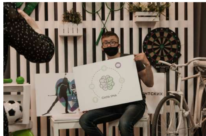
Квиз по материалам обучения в Екатеринбурге