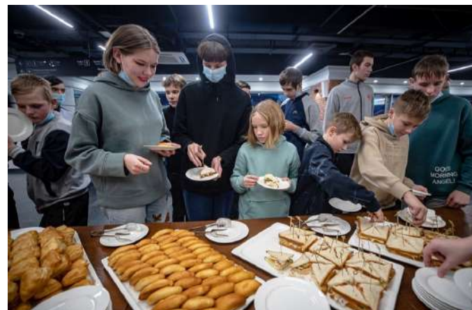
Кофе-брейк для участников мастер-класса