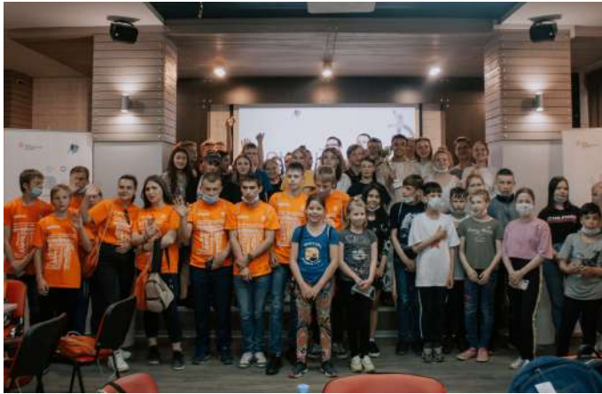
Все участники квиза "Сила ума"