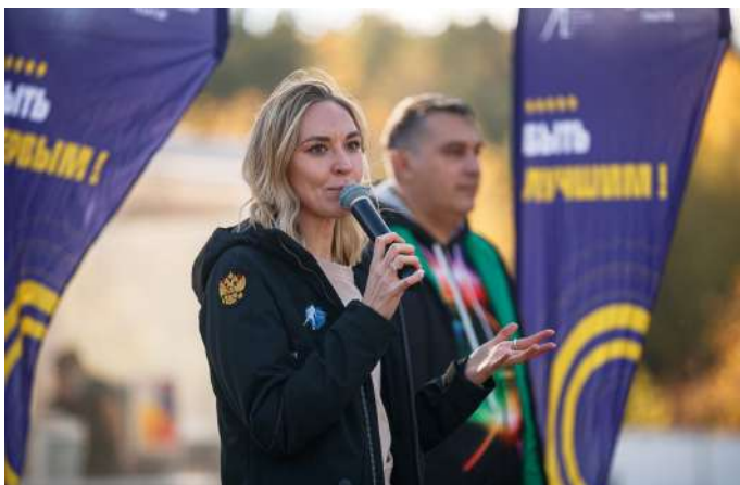
Церемония открытия соревнований