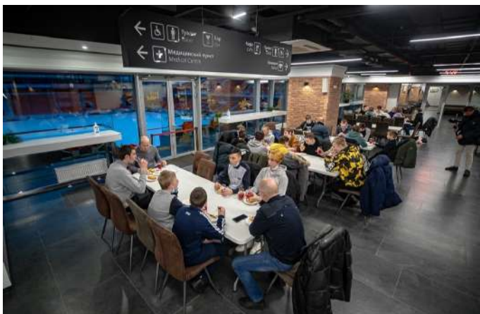
Кофе-брейк для участников мастер-класса