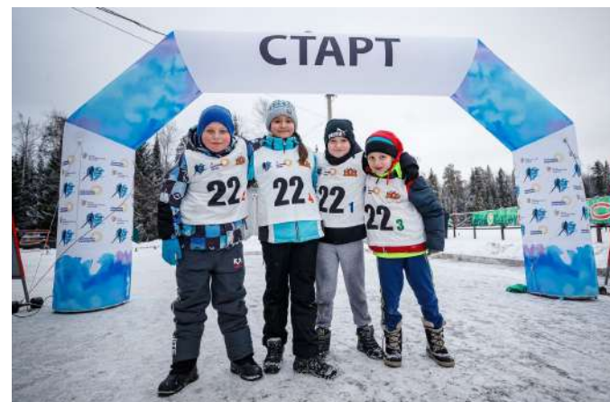
Участники соревнований на старте полосы препятствий