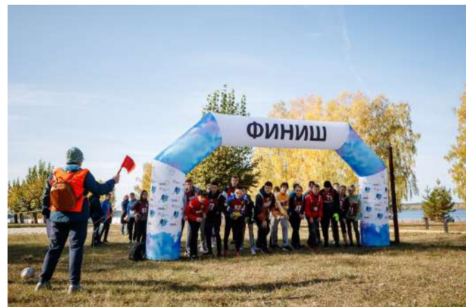
Участники соревнований на старте