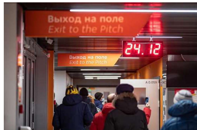
Экскурсия по "Екатеринбург-Арене"