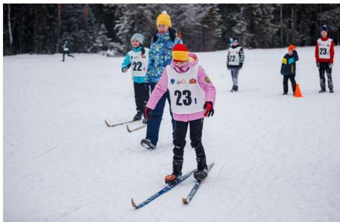
Этап соревнований - "зимние забавы"