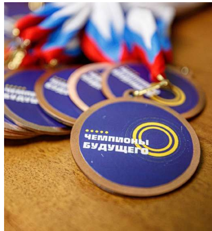
Медали для призеров и победителей соревнований