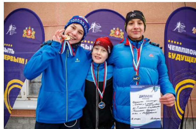
Победители соревнований "Лазерная пуля"