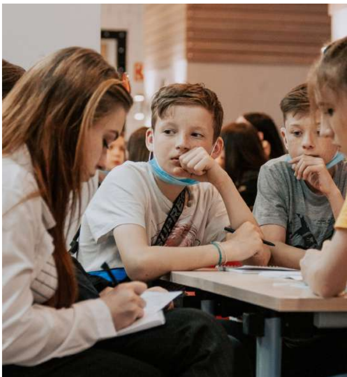
Квиз по материалам модулей обучения "Сила ума"