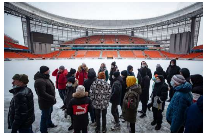
Экскурсия по "Екатеринбург-Арене"