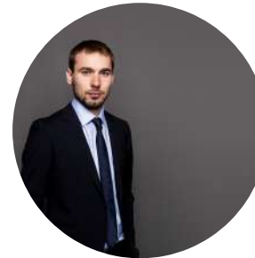
Шипулин Антон Владимирович

Учредитель, Председатель Правления Фонда