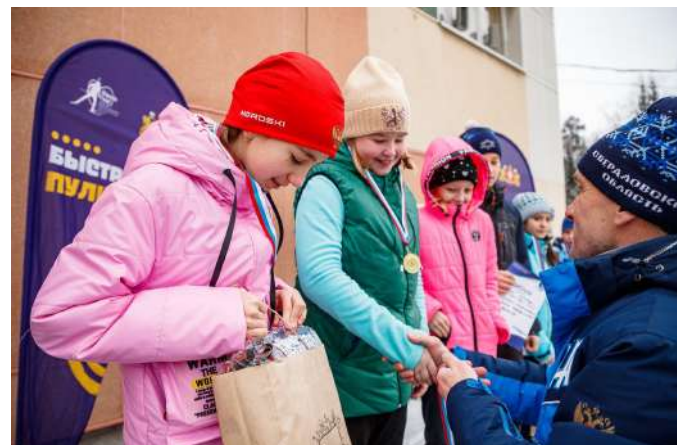
Награждение призёров соревнований